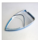
SOLETTA TEFLON CORAZZATA 1,5 kg AR8P 1,7 kg AR8C