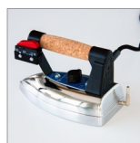
FER1200 Elettroferro "pesante" 1,7 kg