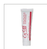
AR29 Pasta puliferro