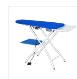
TAVOLI Aspiranti, riscaldati, soffianti